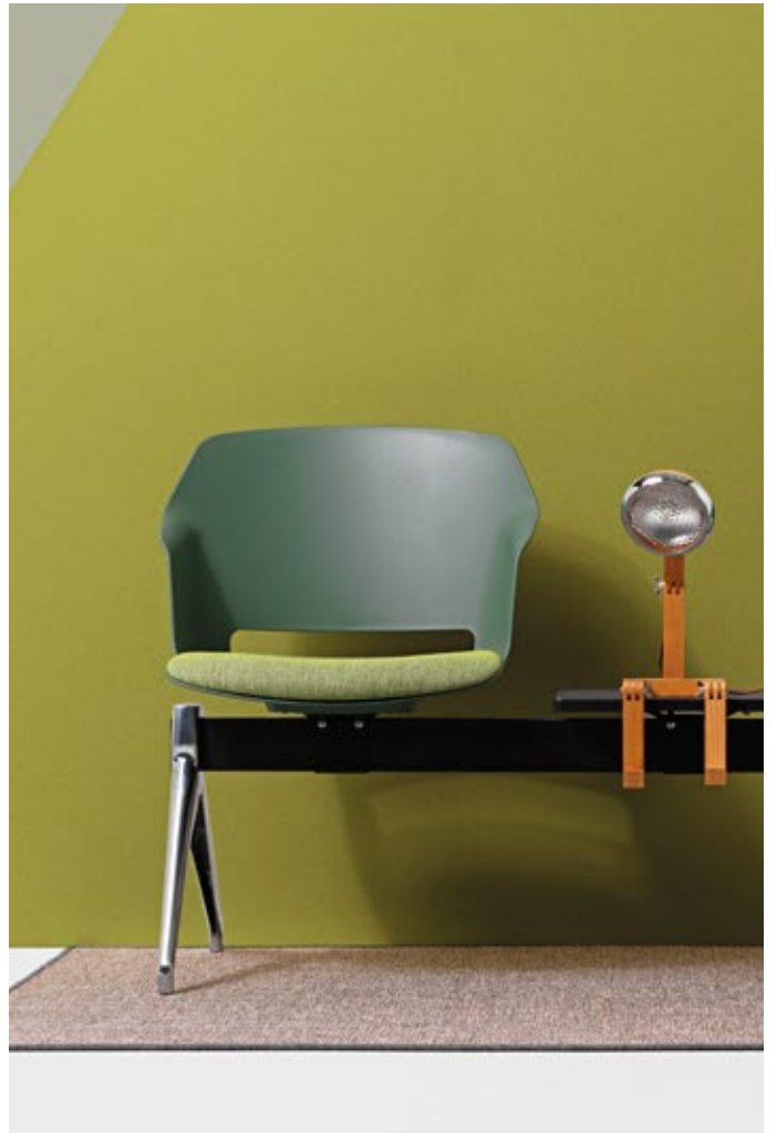
Verde - Hestan 7035.22