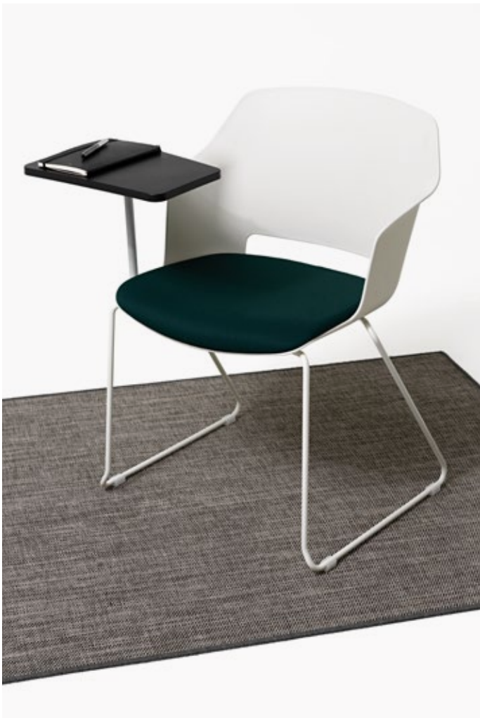
Bianco - Mirage 496